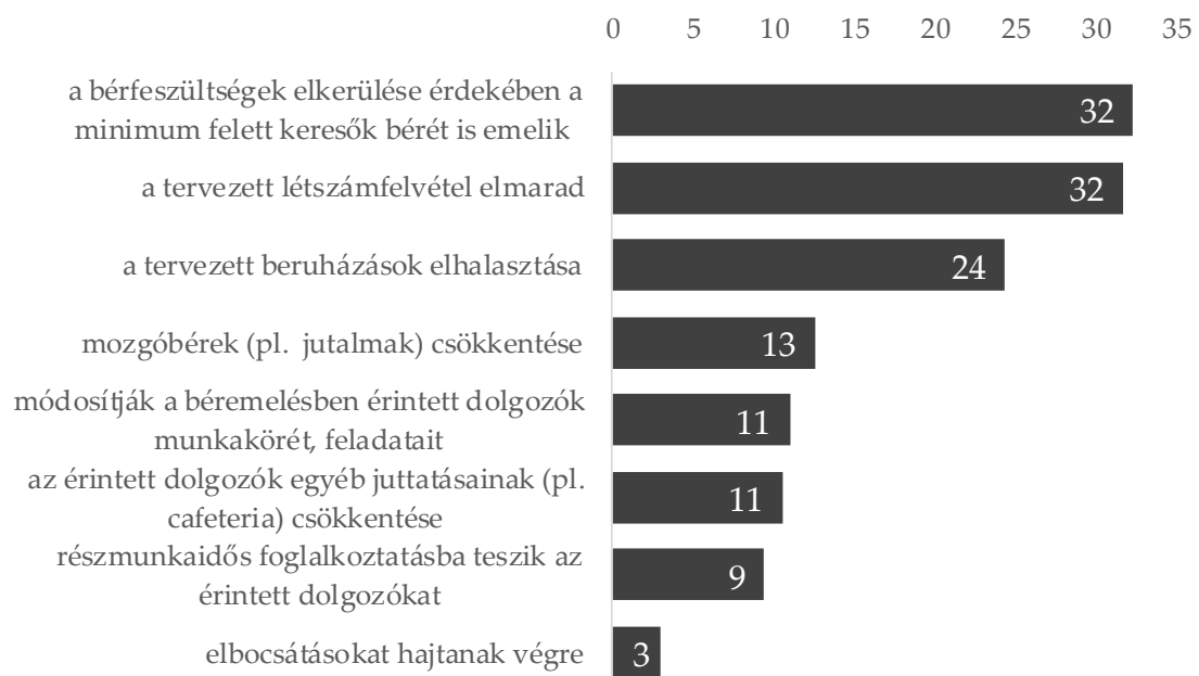
1. ábra: Azon vállalkozások aránya, amelyeknél a minimálbér, illetve a garantált bérminimum emelése nyomán sor került / sor fog kerülni a felsorolt lépésekre 2018-ban, százalék

közel negyede (24%) tervezi. A cégek 13%-a döntött a mozgóbérek (pl. jutalmak) csökkentése mellett. Nagyjából minden tizedik vállalkozás módosítja a béremelésben érintett dolgozók munkakörét, feladatait, csökkenti egyéb juttatásait, vagy részmunkaidős foglalkoztatásba helyezi át őket. A legkevésbé jellemző reakció az elbocsátások végrehajtása: ezt mindössze a cégek 3%-a jelölte meg.