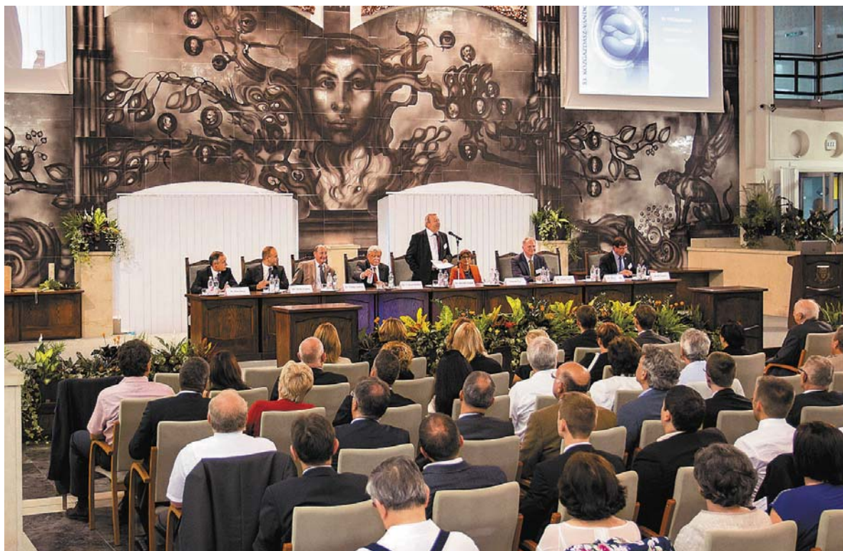
A Miskolci Egyetem adott otthont a háromnapos rendezvénynek

Az 53. Közgazdász-vándorgyűlés több szempontból is rekordot döntött, hiszen az idei volt az elmúlt évek legnagyobb