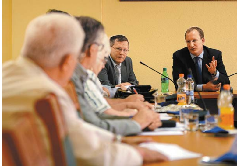
Koszorús László, a Nemzeti Fejlesztési Minisztérium fogyasztóvédelemért felelős államtitkár-helyettese tartott tájékoztatót a BOKIK-ban a törvényi változásokról

A vállalkozás köteles internetes honlapján, az általános szerződési feltételeiben, külön formanyomtatványon, vagy az üzletben jól láthatóan és olvashatóan tájékoztatni a fogyasztót arról, hogy el nem intézett panaszra ügyében