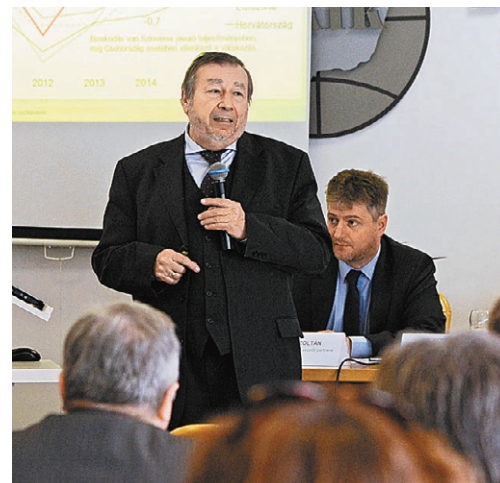
Dr. Kovács Árpád a magyar gazdaság és a költségvetés helyzetéről beszélt

Elmondta, hogy a jegybank az új hitelprogramot a hosszú távú, fenntartható gazdasági növekedéshez szükséges tartós hitelezési fordulat elérése érdekében indította el. Jelenleg ugyanis a közepes kockázatú, de még hitelképes vállalkozások a szigorú hitelezési feltételek miatt csak korlátozottan jutnak hitelhez, de a magas hitelkamatok miatt sokuk egyáltalán nem vesz fel beruházási hitelt. Az NHP+ kerete 500 milliárd forint, amely elsősorban új beruházások finanszírozására nyújtható. A legalacsonyabb hitelösszeg 1 millió forint, a maximális pedig 500 millió forint lehet.