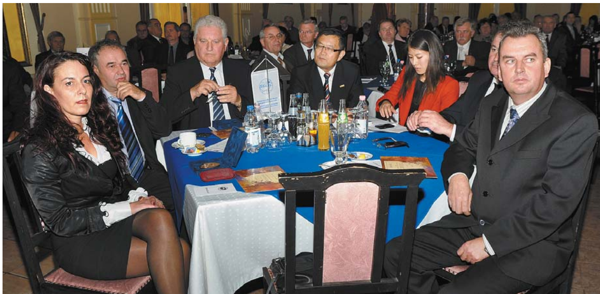
Kitüntettek a Kamara napján 2013-ban

venes években, vagyis az új rend kialakításánál mindenki tele volt reménnyel, kíváncsisággal és tenni akarással: vállalkoztunk. Fontosnak éreztem, hogy a kezdetektől a BOKIK tagja legyek vállalkozóként, hiszen politikamentes, korrekt, a gazdaság érdekeit képviselő, szakmai szervezethez csatlakozhattam. Az 1994. évi törvény közjogi státust adott a kamarának: komoly felhatalmazást adott a szervezetnek, egyúttal tisztította a gazdaságot, egyfajta garanciaként szolgált. Fontosnak tartom, hogy alelnökként, majd kollégiumi elnökként is olyan személyekkel dolgozhattam, és dolgozhatom együtt, akikkel lehet eszmét cserélni, szakmai egyeztetéseket folytatni. Egy gazdasági szereplő hitelességét az elért eredmények adják, egy szervezetet pedig a munkája hitelesít. Azt gondolom, az elmúlt 20 év garancia mindezekre.”