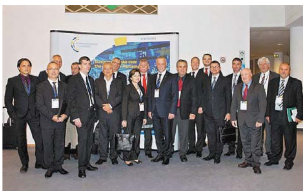
Az Európai Vállalkozói Parlament magyar képviselőcsoportja

A BOKIK energiahatékonysággal foglalkozó, 3 éves STEEEP elnevezésű pályázatának megvalósítása jó ütemben halad. A projektbe bevont vállalkozások energetikai felmérése lezárult, készül a cégek számára az energia menedzsment terv is. November 12-én megtartották a projekt első workshopját is. A rendezvényen egyebek mellett szakértő ismertette eddigi tapasztalatait a vállalkozások energetikai felméréssel kapcsolatosan. Mivel jelenleg az energetikai pályázati kiírások nyitva állnak – mind a lakosság, mind a vállalkozások részére –, így a workshop tematikájának fontos részét alkották. A rendezvényen résztvevő mintegy 30 fő elégedett volt a workshopkal, az előadások után sok kérdés hangzott el, és kihasználták a konzultációs lehetőséget is. A következő workshopot előreláthatólag 2015 első hónapjaiban tartják.