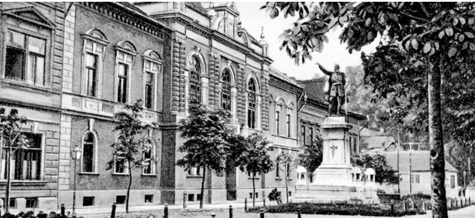
A kamara egykori székháza ma a miskolci akadémiai bizottságnak ad otthont