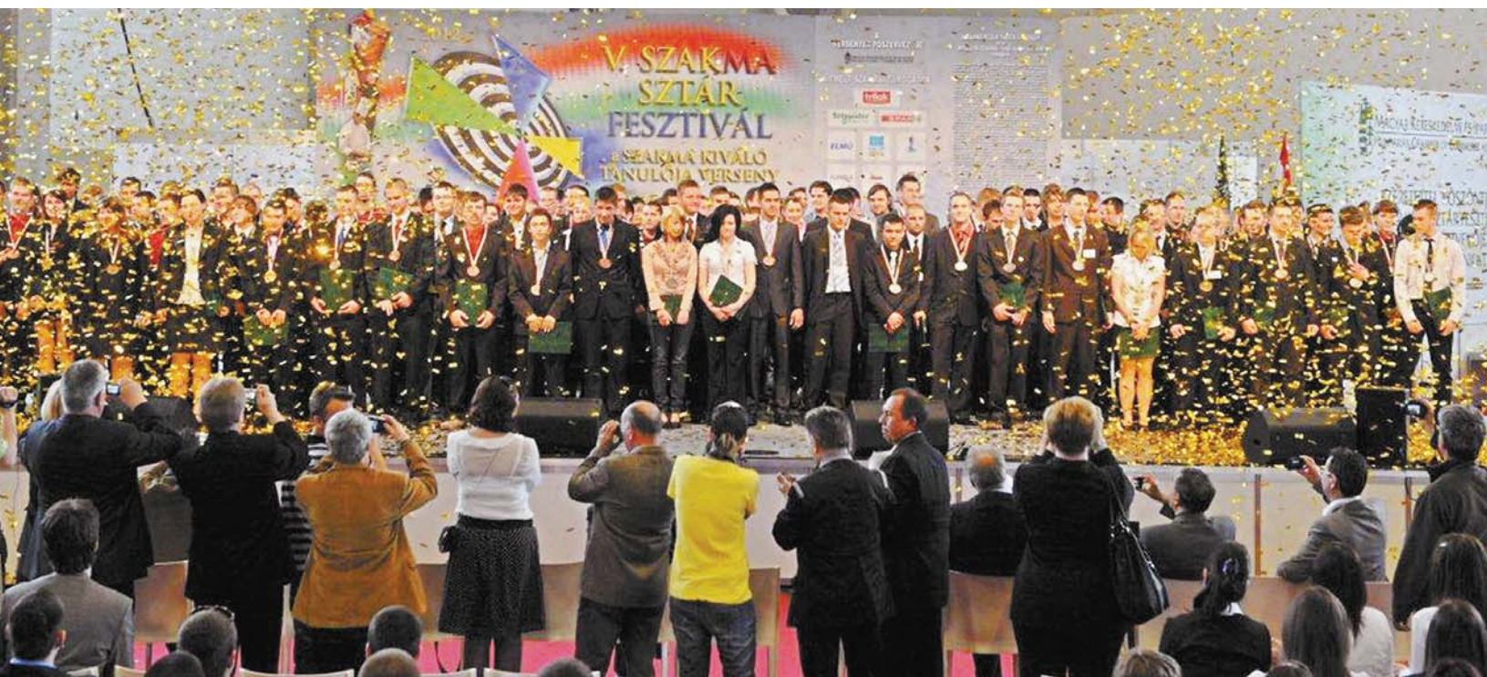
Minden évben sztároknak kijáró show-val végződnék az országos szakmai döntők Budapesten