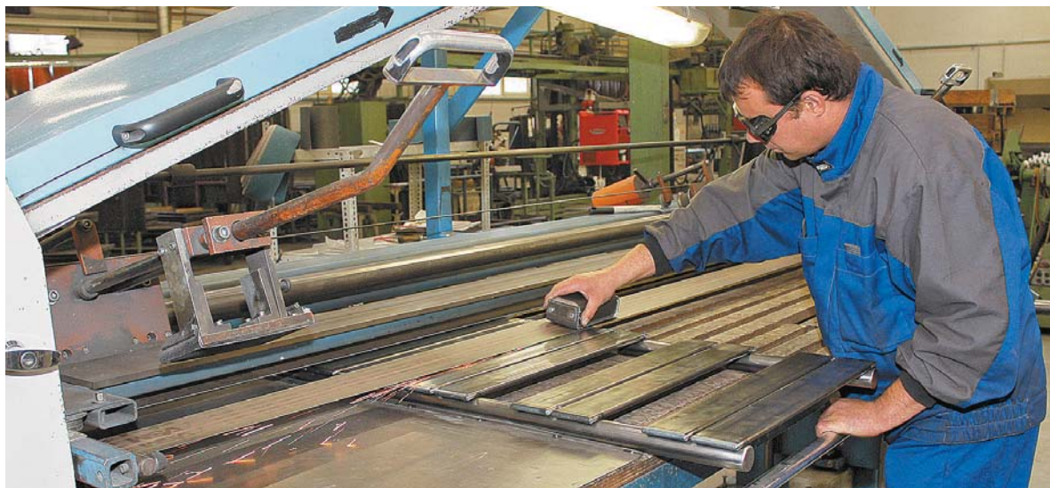
Közel kétezer önkéntes tagja van a BOKIK-nak, sok vállalkozás már az 1994-es alapítás óta kapcsolatban áll a kamarával

atba lépni olyan megbízható cégekkel, amelyek a mai napig is jelen vannak vállalkozásunk életében. Fontosnak tartom az utánpótlás-nevelést, ezért egyre nagyobb szerepet vállalunk a kamara szakképzési munkájában is. Cégünk néhány éve nyilvántartott képzőhely. Tanműhelyt is kialakítottunk gyártóüzemünkben 2010-ben, ezzel is erősítve a kamara törekvéseit, és amelylyel helyben biztosítunk elhelyezkedési lehetőséget sok fiatal szakember számára. Ezen felül képviseljük magunkat a megyei szakképzési bizottságban is. Olyan jó kapcsolat alakult ki a BOKIK és cégünk között, amely példaértékű. Tudom, hogy bármikor lehetőségem van arra, hogy tanácsot kérjek és kapjak, legyen az akár jogi, akár szakmai természetű.