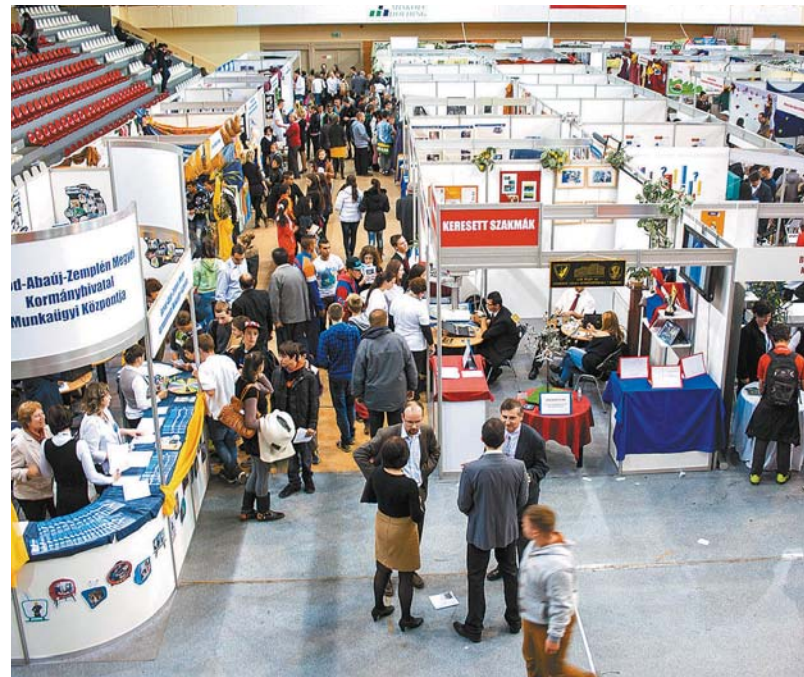
A kiállítás idejére elkészült a BOKIK pályaválasztási kiadványa is Szakképzési útmutató címmel